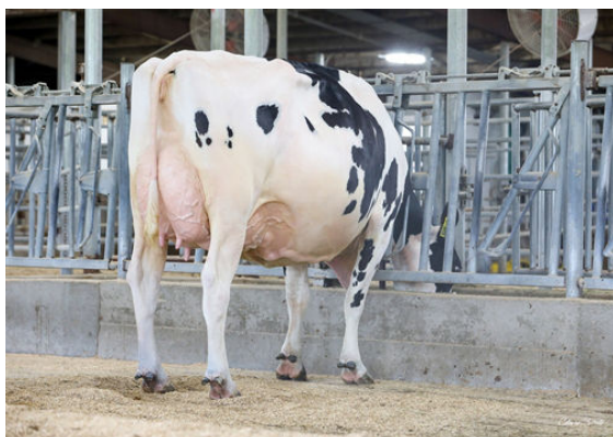
AOT DELUXE HI-LIGHTED GRANDDAM